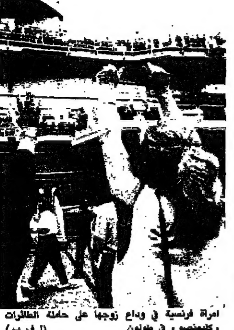
امراء فرنسية في وديع زوجة على حملة الطائرات كليمسو، في طولون.